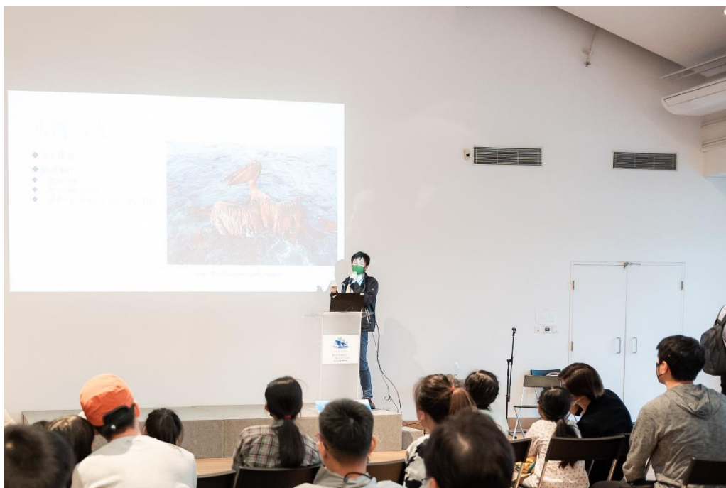
( 海洋生態講座 )

於開放日當天，公眾將可透過多元化的親子活動，包括由資深導賞員帶領的博物館導賞團、博物館尋寶遊、手繪工作坊等，愉快地學習海事知識及歷史。與此同時，更設有海洋生態講座，分享海洋科學知識和經驗，香港的航海歷史、文化及遺產。