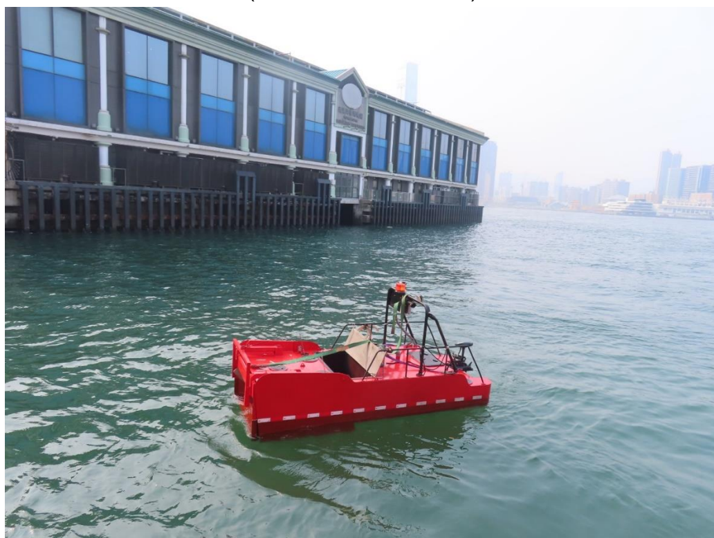
( 海事處海上清理垃圾船示範 )