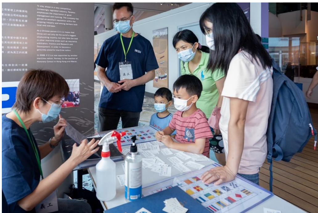
( 香港海員工會遊戲攤位 )