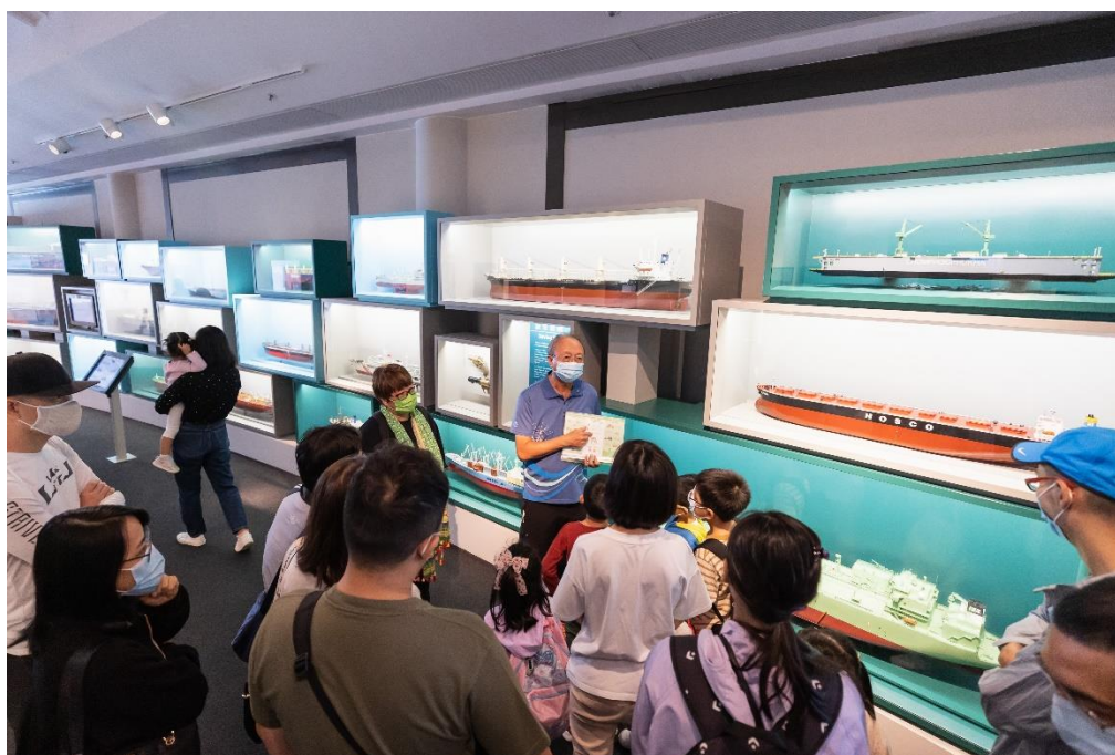
( 導賞團 )

運商。合作團體包括海事處、香港海員工會及公益組織「明音」，為節目增添更多趣味元素。太平洋航運將設立攤位，讓公眾可與年輕學員及資深海員交流之餘，更有機會獲得精美紀念品。專業航海員會親身教授正統的繩結、六分儀、指南針的使用方法，讓公眾更深入了解海員日常工作及航運知識。