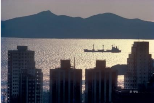
照片中的對岸為香港仔，一艘出港的船正在東博寮海峽航行。