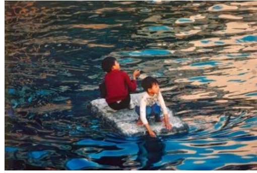
照片攝於上環海旁，兩個年輕人正划著一個人手製作的浮板。