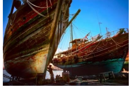
兩艘拖網漁船進行維修中。