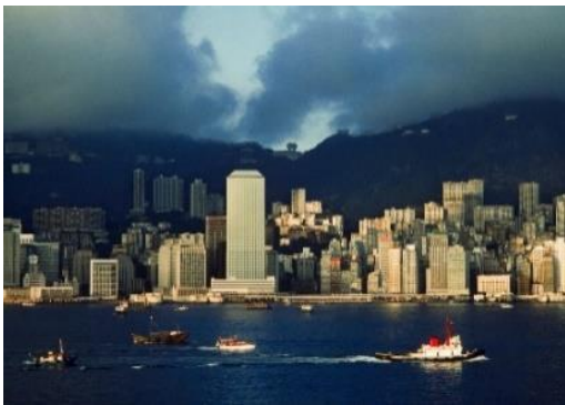
照片可以看到康樂大廈（即今天的怡和大廈），這張照片應該是 1973 年或之後所拍攝的。

Brian Brake 的照片在 1960 至 1970 年代中期拍攝。這段時期的社會，包括港口設施均有顯著的發展，市民的生活也有改善。