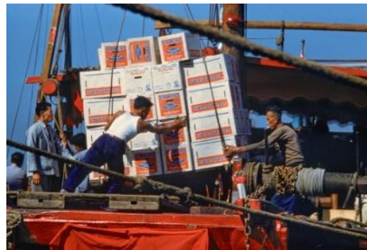
在 1960 年代和 1970 年代，大部分的食品供應都是經船運抵達的。

Edward Stokes 的照片於 1979 年拍攝，正是香港轉型為現代大都市的關鍵時刻。一張照片中記錄了兩名男孩的身影，他們看來營養良好，想必已上學接受教育，這是 1946 年代水上人子女不敢奢望的生活。