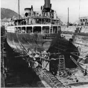
太古船塢的乾塢於1907年完工，當時能容納當時世界上最大的船隻。