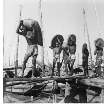
在碼頭工作的男人和男孩因長時間在戶外工作而曬得黝黑。

Brian Brake 的照片在 1960 至 1970 年代中期拍攝。這段時期的社會，包括港口設施均有顯著的發展，市民的生活也有改善。