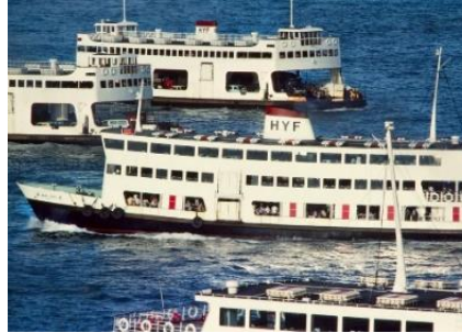
在1960年代和1970年代，香港油麻地小輪船有限公司的渡輪連接著中環和佐敦，亦有航線往返市區和大嶼山/長洲。